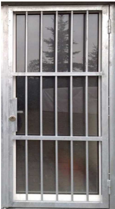
Beispiel, Gittertürmodell 2 als 1 flg. Türe mit 65 mm Dorn - Schloss u. Schutzrosette mit Zylinderabdeckung