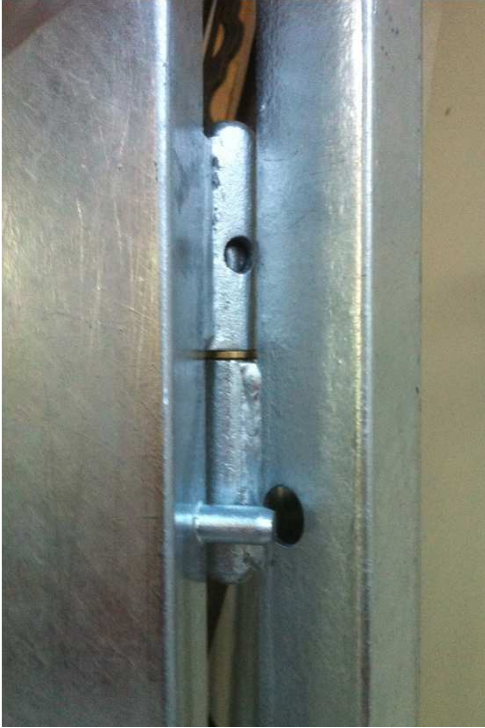
2 Stk. schwere Anschweissbänder mit Aushebelschutz